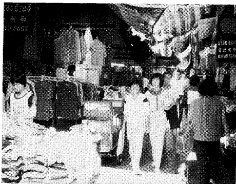
サンパン街の生地卸問屋

入れる。セントラルデパートの場合には、グループ関連会社の中にスポーツウェアやブランド製品専門の製造工場ももっているほどである。しかも、百貨店・スーパーの既製服の多くは、国際的なブランド製品（タイ国内での委託生産）か、名の通った国産ブランド製品であった。その結果、タイの Apparel 産業は、ノーブランドの定番品や「にせブランド」を中心に売るボーバー街や公営市場（タラート）・青空市と、ブランド製品中心の百貨店・スーパーのふたつの販売ルートに分かれることになった。なお、両者の違いは、廉価販売・値引き交渉が可能な世界と正札・定価販売の世界の違いにも対応している。