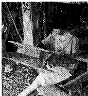
シーサーチャナーライ地方の特産礼服の縁飾り（パー・ティンチョック）を織る少女

それ以前のタイでは、服といえば制服を除いた場合、生地を買って仕立てるのが普通であり、つるしの既製服を買う習慣はほとんどなかった。タイで十年間以上繊維を担当してきた日本の大手商社員の回想によると、一九七〇年代初め頃には、タイで既製服が売れるなどとは思ってもしなかつたそうである。ところが、ジーンズは厚地のデニム生地できているため、既存の仕立屋ではうま