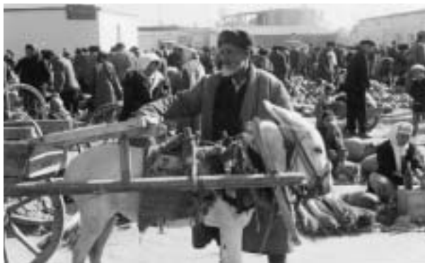
1960年代のヒブア市の市場