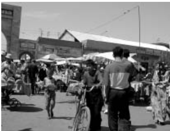
ナマンガン市の市場(2003年撮影)