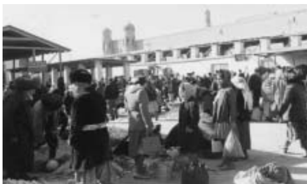
1960年代のヒバア市の市場。

不幸なことに、祖父のこの言葉はブラックジヨークではなく正確な予言となってしまった。