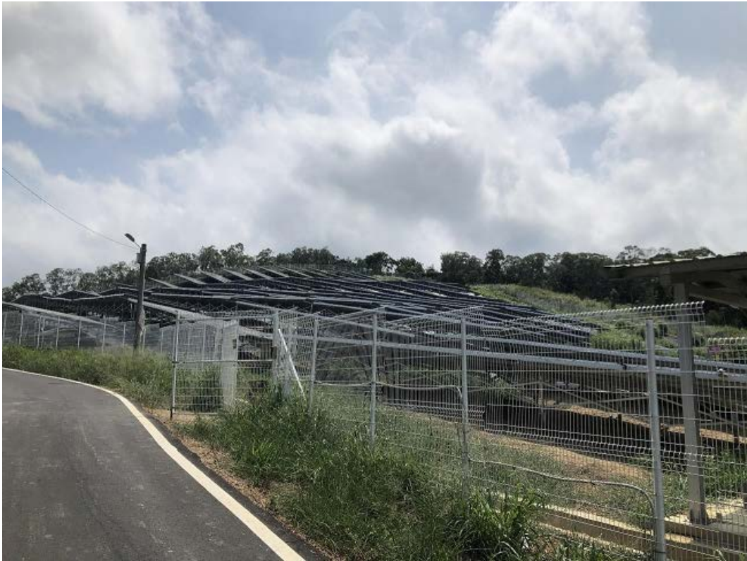
写真1 苗栗県通霄鎮に位置する「小光電」