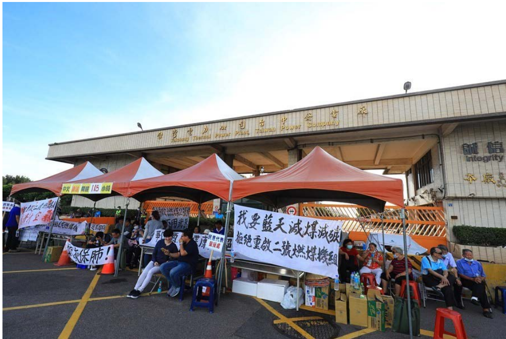
写真3 台中火力発電所に向けた座り込みデモ活動