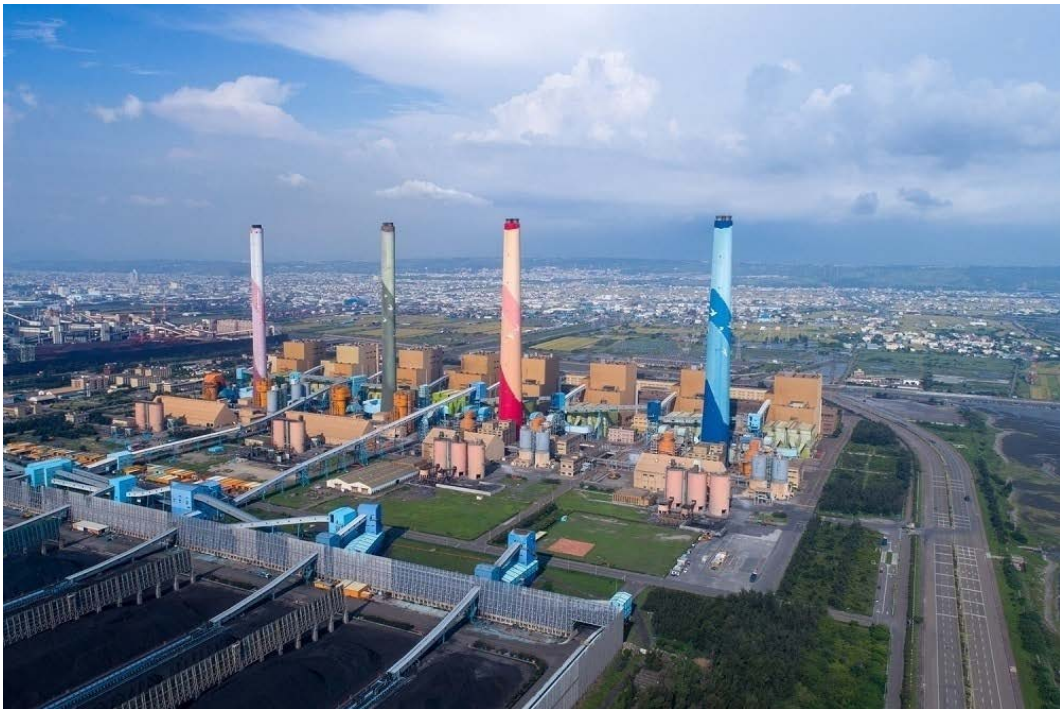
写真2 台湾最大の石炭火力発電所——台中火力発電所