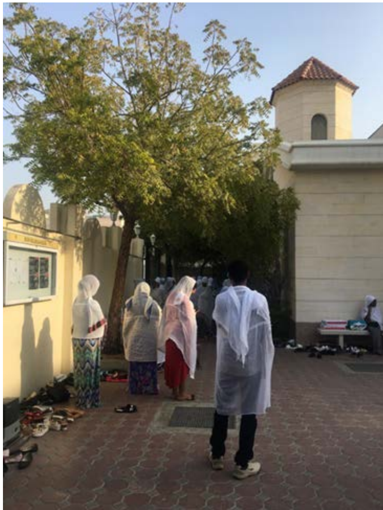
写真1 エチオピア正教会の礼拝に集まる人々 (アラブ首長国連邦シャールジャ市にて)

14 Rothna Begum, Domestic Workers in Middle East Risk Abuse Amid COVID-19 Crisis , Human Rights Watch (2020 年 8 月 11 日閲覧)。