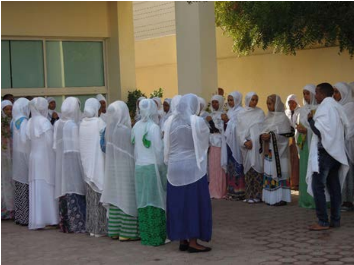
写真2 エチオピア正教会の礼拝に集まり歌を歌う人々（アラブ首長国連邦シャールジャ市にて）