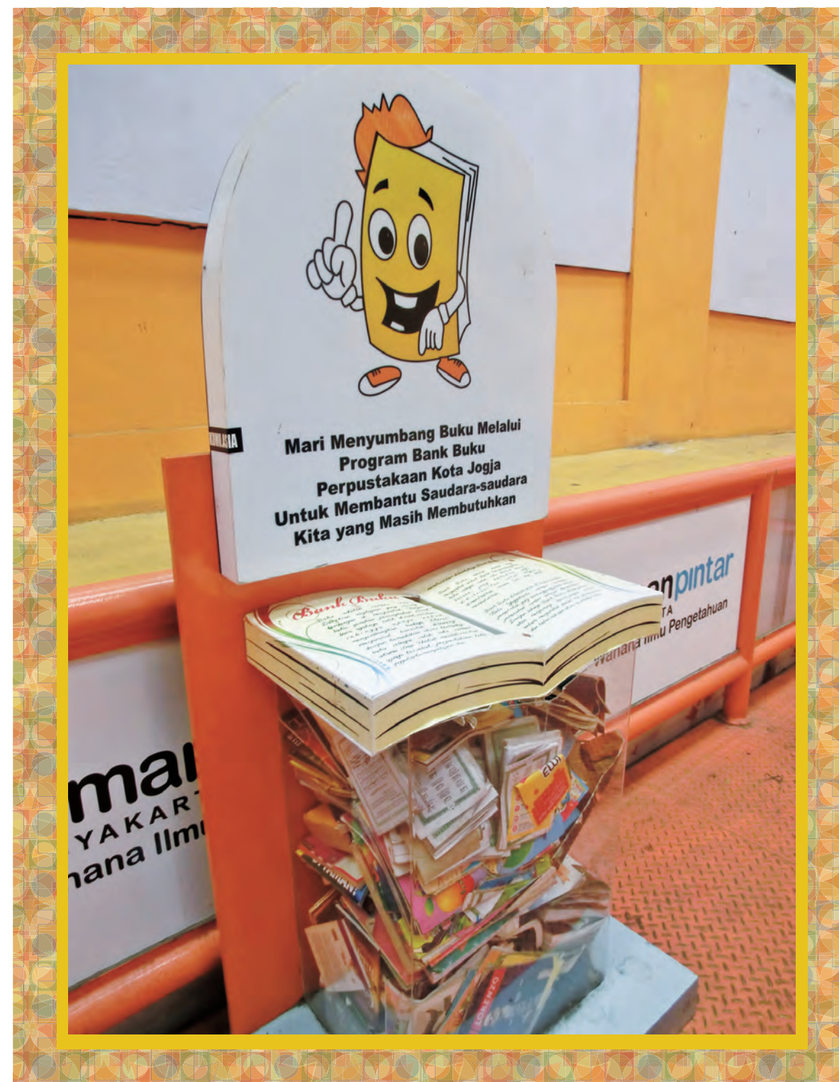
ジョグジャカルタにて本の寄贈を募るために設置されたポスト

本誌は「グリーン購入法」の判断基準に従い、再生紙を使用しております。 ISSN 1341-3406