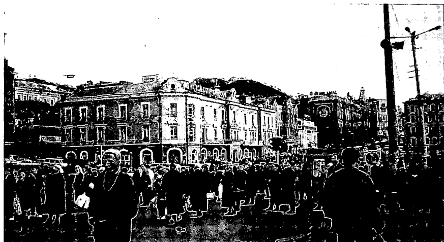
通勤の人々にぎわうウラジオストク

選挙管理委員会では、州が定めた二院制は、ロシアの国家権力構造と同質であり、中央選管の見解には根拠がないと主張しつつも、結局中央の見解を取り入れざるを得なかった。